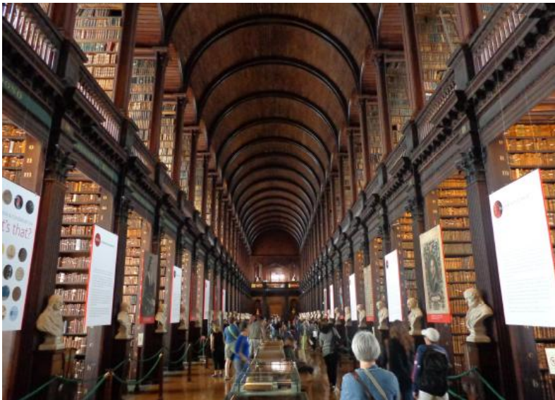
کتابخانه کالج ترینیتی - ایرلند